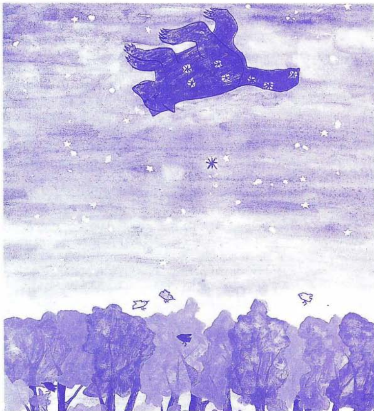
Slika 1. Spomladi zvečer leži Veliki voz nad našo glavo in njegovo oje kaže proti vzhodu. Ilustracija Marte Kotar iz knjižice Marijana in Stane Prosén: Male zgodbe o Velikem vozu (Math, 1996).

Tokrat bi vas rad navdušil za opazovanje ene najsvetlejših zvezd, ki jo z lahkoto najdemo na nebu, če le poznamo Veliki voz. Ob pomladnih večerih leži Veliki voz nad našo glavo tako, da njegovo oje gleda proti vzhodu. To lego Voza lahko s pridom uporabimo za orientacijo na zemljišču (slika 1).