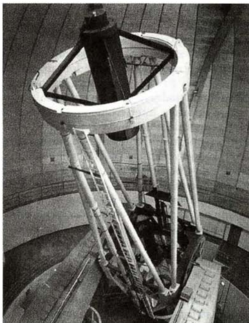
Slika 4. Trimeterski teleskop na ameriškem observatoriju Lick (blizu mesta San Jose v Kaliforniji) slovi po doslej največjem številu (4) odkritih kandidatov za planetne sisteme. Teleskop je star 37 let.