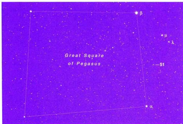
Slika 1. Na sliki je prikazana lega zvezde 51 Pegasi v ozvezdju Pegaz. Štiri svetlejšje zvezde tvorijo znani Pegazov štirikotnik, ki ga zlahka najdemo s prostim očesom.

Zvezda 51 Pegasi ima navidezno vizualno magnitudo 5.5, torej jo lahko vidimo s prostim očesom, še posebej, če si izberemo jasno noč in opazovališče izven večjih mest (glej sliko 1). Od nas je zvezda oddaljena štirideset svetlobnih let. Stara naj bi bila nekaj milijard let, sveti podobno kot Sonce in se prav tako kot Sonce tudi počasi vrti okrog svoje telesne osi.