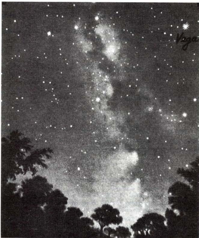
Slika 1. Rimska cesta – risba.

Sredi poletja se v večernih urah na naše nebo povzpne mlečni trak Rimske ceste tako, kot da bi opasal vse nebo, saj poteka od juga prek zenita do severa. Ne zamudite priložnosti in občudujte to lepo naravno znamenitost.