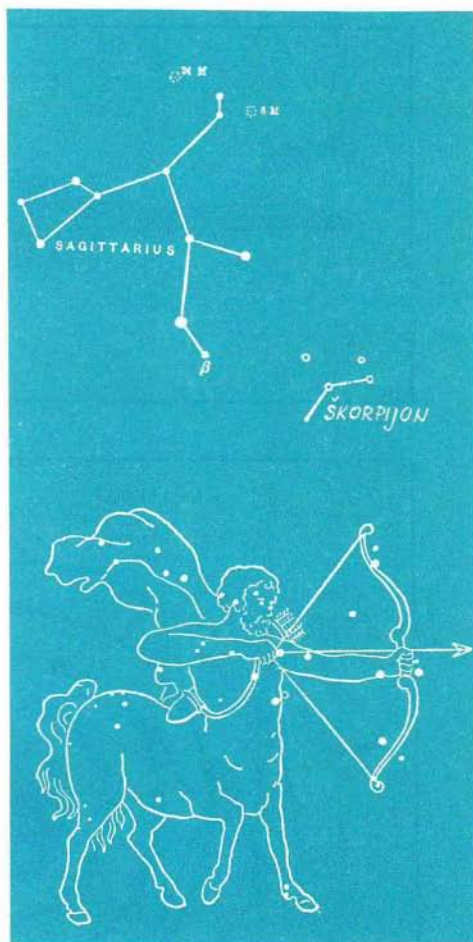
Slika 2. Ozvezdje Strelec – Sagittarius (lat.) in Mlečni voz v njem je pri nas zvečer najbolj vidno od junija do septembra. Mlečni voz je v najprimernejši legi za opazovanje poleti. Izsledimo ga nizko na južni strani neba.

Z daljnogledom opazujte še druge vesoljske objekte: zvezdne kopice in meglice, ki ležijo v ozvezdju Strelec . Ko gledate proti ozvezdju Strelec , se morate zavedati, da je vaš pogled usmerjen proti središču naše Galaksije.