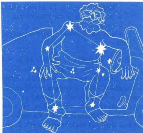
Slika 2. Ozvezdje Voznik upodablja na nebu izumitelja voza (kočije). Slika je iz moje knjžice Veliki in Mali medved , narisal pa jo je akademski slikar Matjaž Schmidt.

Kapela je zvezda, ki so jo zelo proučevali. S posebnimi raziskavami, ki slonijo na interferenci prihajajoče svetlobe z zvezd, so ugotovili, da je