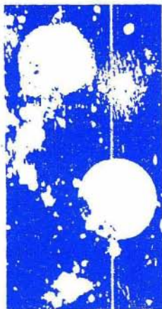
Slika 4. Prva fotografija z rentgensko svetlobo, ki jo je Američan Goodspeed naredil nevede in nehote leta 1890. Na fotografiji je videti senci dveh kovancev, ki sta ležala na fotografski plošči, zaviti v črn papir.

opazil, da so bile osvetljene v črn papir zavite fotografske plošče, ki so ležale v bližini, a se je menda samo pritožil pri izdelovalcu. Goldstein je leta 1880 na javnem predavanju pokazal, da se v katodni cevi svetijo drobni predmeti, čeprav jih ne zadenejo ne elektroni ne kako drugo znano sevanje. Thomson je opazil svetlikanje stekla precej daleč od cevi, čeprav se je prepričal, da ga ne zadene ultravijolična svetloba. Zapisal je, da je v okolici cevi obilo žarkov, ki povzročajo svetelne. To je bilo torej prvo ime za neprepoznano rentgensko svetlobo. Neki Američan je leta 1890 nehote in nevede naredil prvo fotografijo z rentgensko svetlobo (slika 4). Leonard je rentgensko svetlobo leta 1893 celo meril, ne da bi se tega zavedal. Zdelo se mu je, da gre za postranski pojav, do katerega je prišlo zaradi velike občutljivosti merilnikov. Röntgenovo odkritje ga najprej ni sploh vznemirilo. Mislil je, da gre za učinke katodnih žarkov, in je ponovil Röntgenove poskuse. Z Röntgenom je celo skupaj prejel nekaj priznanj. Toda pozneje je zaman