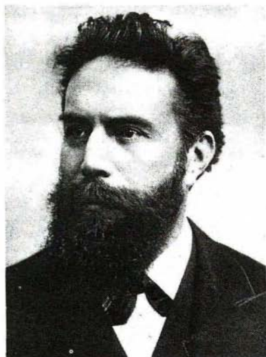
Slika 1. Conrad Wilhelm Röntgen (1845 do 1927)

Conrad Wilhelm Röntgen (slika 1) je bil rojen leta 1845 v Lennepu ob Reni. Kmalu se je družina preselila v nizozemski Apeldoorn. Po študiju na Nizozemskem se je Röntgen odpravil študirat strojništvo na državno tehniško visoko šolo v Zürichu. Tu je bil njegov učitelj najprej Rudolf Clausius in nato August Kundt. Diplomiral je leta 1868 in naslednje leto doktoriral na univerzi v Zürichu. Postal je asistent pri Kundtu, z njim je prešel na univerzo v Würzburgu in nato na univerzo v Strassburgu. Leta 1875 je Röntgen postal profesor na univerzi v Giesnu. Nato je predaval na drugih nemških univerzah in se leta 1888 vrnil na univerzo v Würzburgu, kjer je bil prej Kundtov asistent.