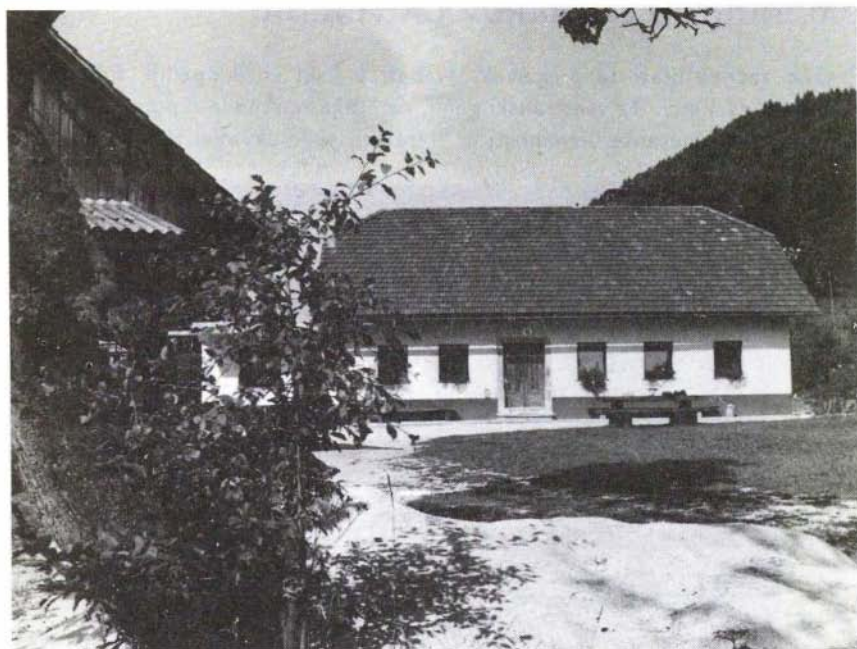
Vehova domačija v Zagorici.

vznožju gričevja cerkev Svete Helene. Mimo nje vodi cesta do Zagorice, kjer si pri Pokovčevih ogledamo Vegovo spominsko sobo in Vegov kip pred njo. Nadaljujemo po cesti do Križevske vasi, kjer najdemo na cerkvi spominsko ploščo iz prejšnjega stoletja, ki so jo ob tedanjem velikem shodu postavili Vegi v čast. Če nato krenemo po zložni poti v hrib, pridemo po petnajstih minutah hoje do razpotja. Po desni poti pridemo čez Cicelj do cerkvice Svetega Miklavža, od koder je ob lepem vremenu čudovit razgled po dolini Save in kjer je kot zanalašč pripravljena vrtača z nogometnim igriščem. Če pa gremo na razpotju na levo, pridemo precej hitreje do Murovice, kjer se odpre pogled proti Ljubljani. V obeh primerih se lahko spustimo nazaj proti Savi, lahko pa tudi na drugo stran v Moravče.