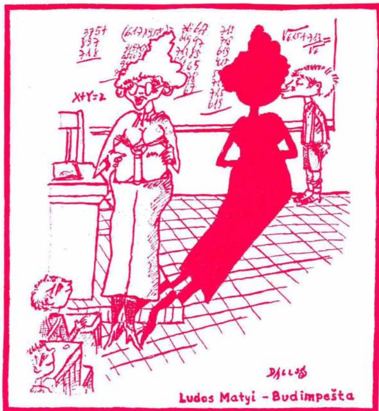
Ludos Matyi - Budimpešta