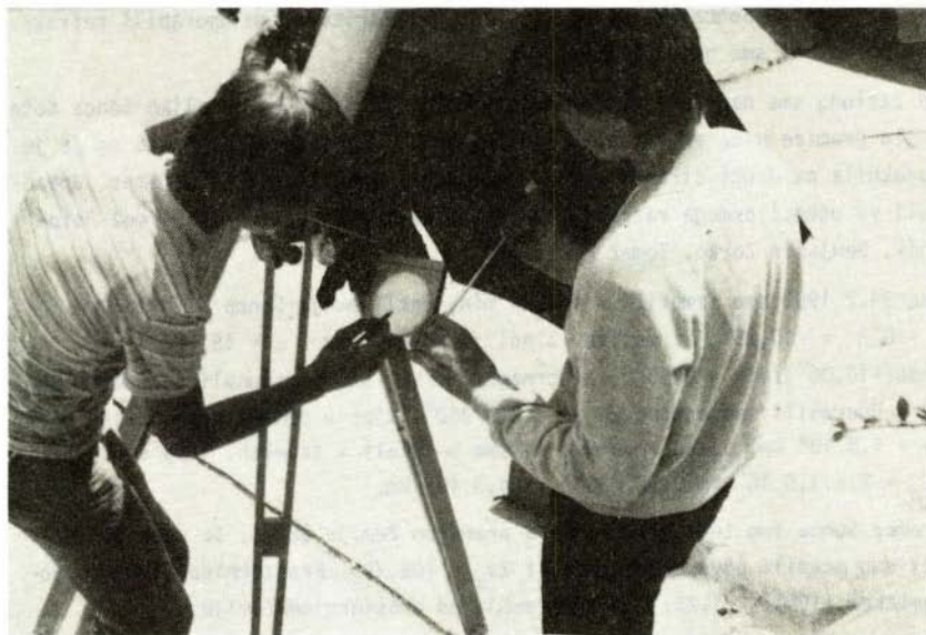
SI. 2 Opazovanje Sonca na zaslonu. Učenca skicirata lego šončevih peg.